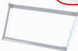
Art. 101.PC - ACCESSORIO PORTA CARTA