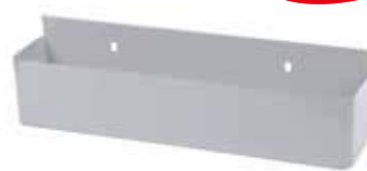
Art. 101.PF - ACCESSORIO PORTA FLACONI