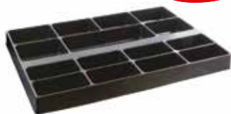
Art. 101.PM - ACCESSORIO PORTA MINUTERIA